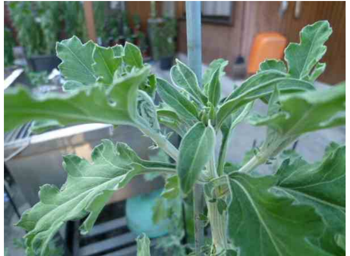
柳芽の処理を現物が出来なかったので写真で説明しました。