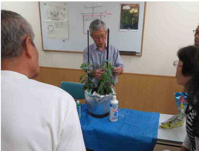
わき芽摘みの説明と実演です。