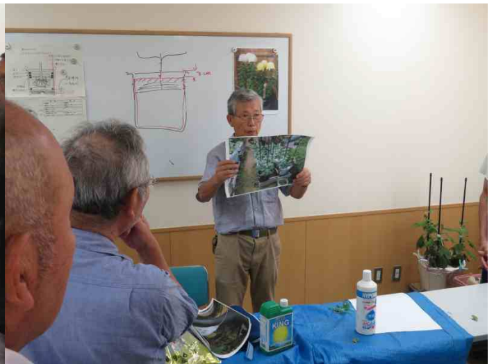
テキストにありませんが暑さ対策のアドバイス。