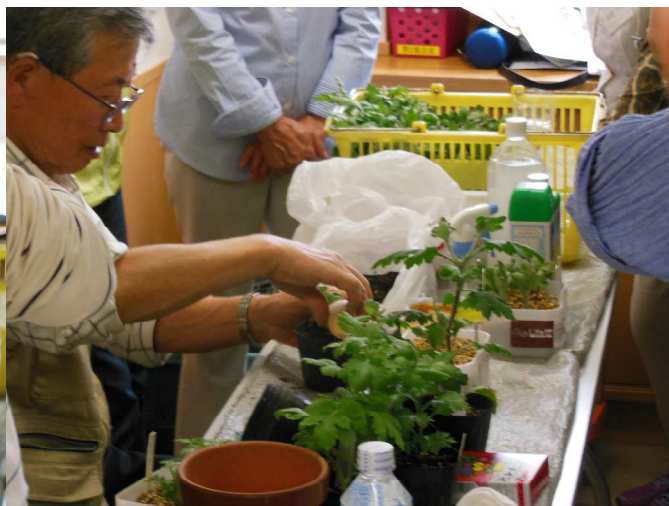
ポットに植えます。