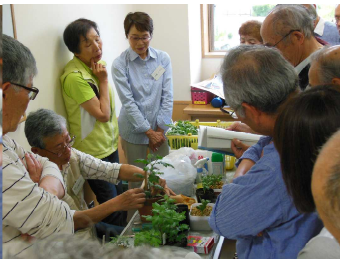
人の高さ位置を決めて植えると 定植の時、都合が良い。