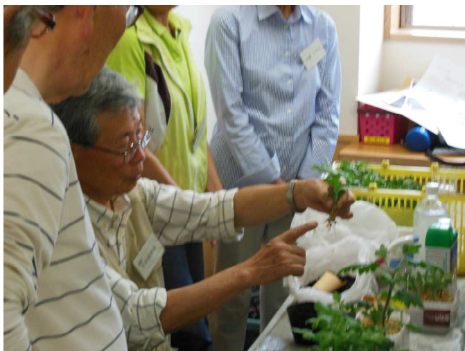
根の長いのがあり、切ります。