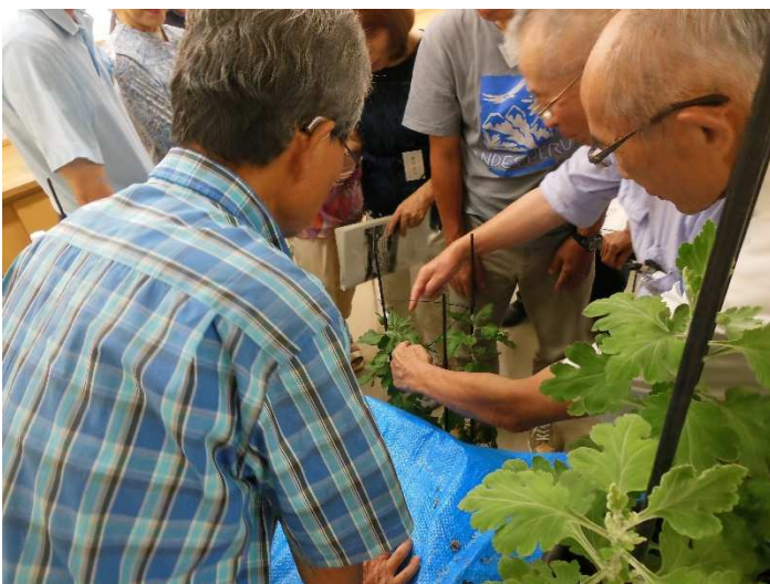
柳芽が出ています。よく見えなくて残念。