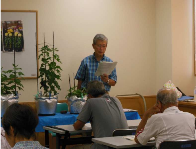
テキストに基づき追肥・増し土・わき芽摘みを説明しました。