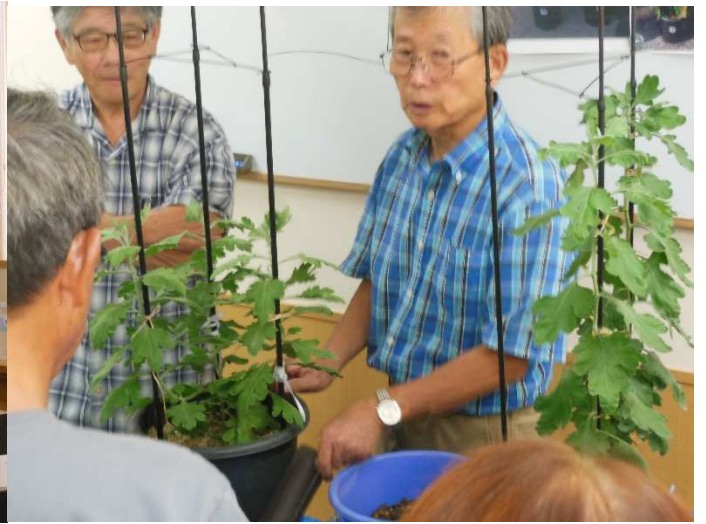
セパレータを抜きます。