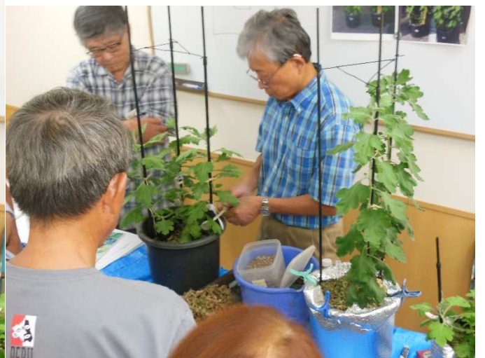
乾燥肥料を追肥しました。