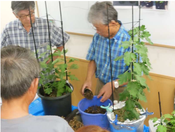
セパレータを抜いて培養土を入れます。