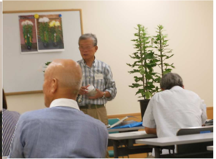
PK 剤の施肥と苦土石灰の施し。