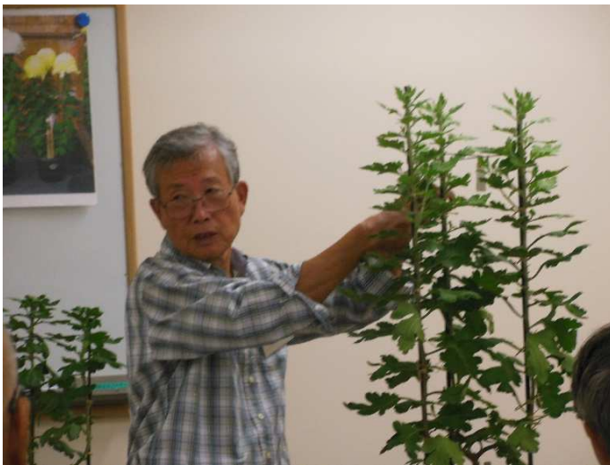
咲かせる蕾を決めたら支柱の縛り直し。