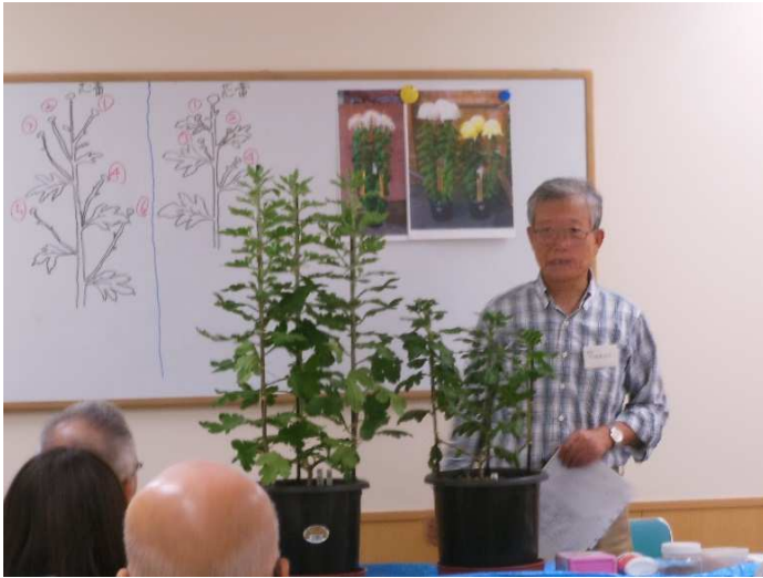
出蕾期の手入りを説明。