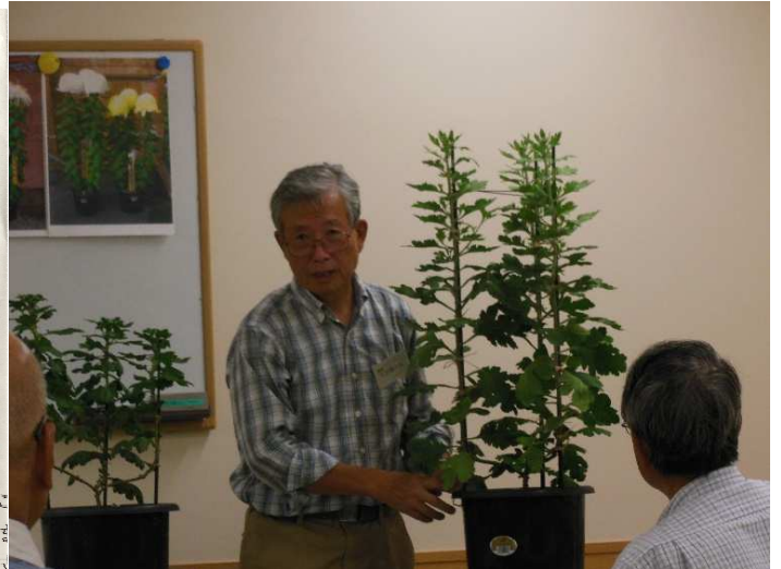
鉢を反時計方向に期日を決めて回しましょう。