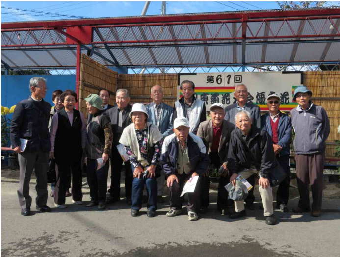
当日参加した会長代理と会員の皆さんです。