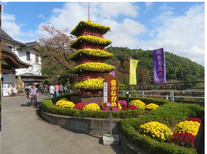
ながめ公園菊祭り会場です。