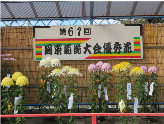
菊祭り代表作です。立派な作ですね。