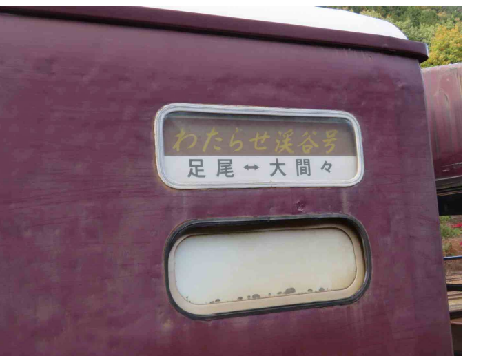
わたらせ渓谷鉄道の「トロッコ列車」が足尾駅に入ってきました。この列車に乗り大間々町に行きます。