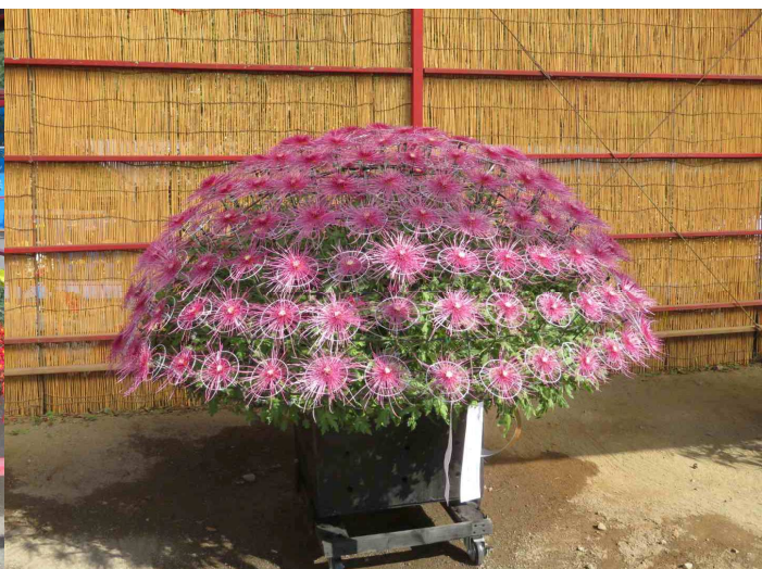
見事な1000輪咲きです。